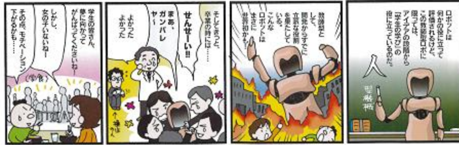
※2005年の夏休みにあべかよこの先生が制作した、バーチャルE-マン。

だって、食事をしている間に見かけた女の子はたった3人。 は、工業大学ですからねー、でも、中学校のプリント男たち、 女の子がたっくん写ってましたー、トラップか？ www.abekayokonote.blog17.fc2.com