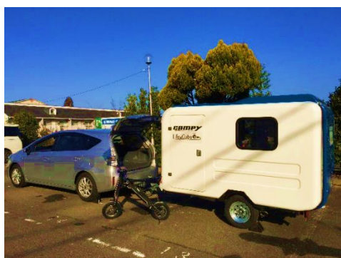
ライフプラグを搭載したプリウスαでライフキューブを牽引。EVバイクの充電もできます

工事現場で使用する電動工具類の充電のほか、照明を設置して快適な作業環境づくりができます。